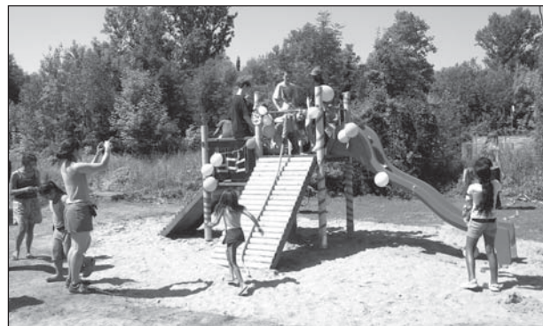
HRACÍ PLOCHA udělala radost všem dětem, které bydlí na Bedřišce.