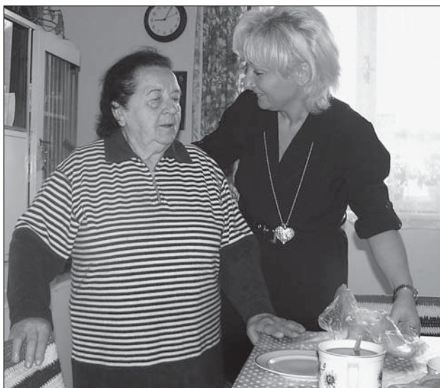
CHARITNÍ pečovatelská služba Tereza pomůže ve svízelných situacích.